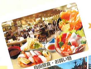
自由昼食・お買い物