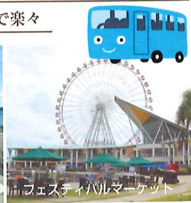
フェスティバルマーケット