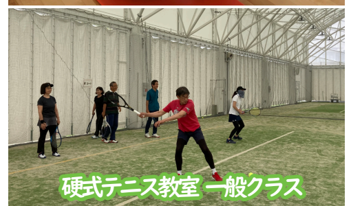
硬式テニス教室 一般クラス