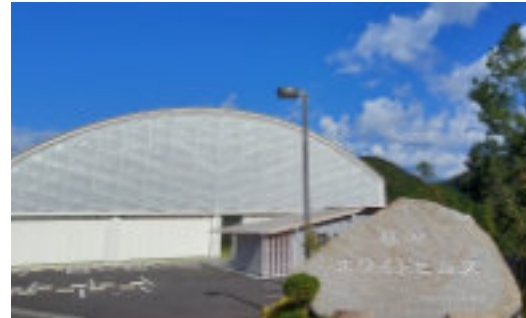
・屋根付き運動広場 外観